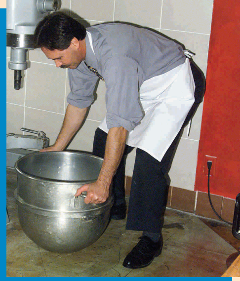
Huwag ibaluktot ang inyong likod

Isipin ang Ergonomiya-ang pagbagay ng gawain sa tao Para sa mga maliliit na negosyo Kainan at inuman