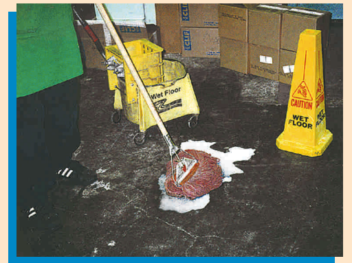
Linisin ang mga natatapon.

2 PANATILIHING MALINIS ANG PINAGTATRA- BAHUAN