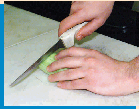
Huwag hayaang nakaharang ang mga daliri.