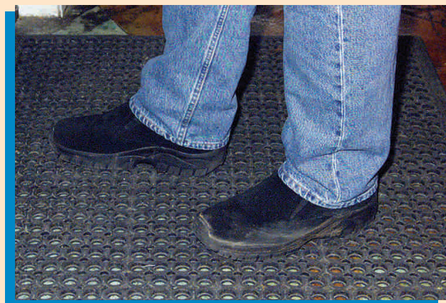
Magsuot ng mga sapatos na sarado ang dulo at may mahusay na suporta