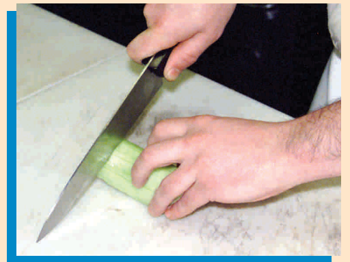
Piliin ang tamang kutsilyo, hawakan ng maayos ang kutsilyo at ang produkto.