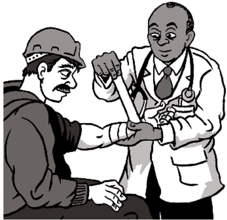
부상을 당한 경우 치료를 받을 권리가 있습니다.