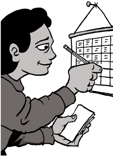
근무 시간을 기록하십시오.

귀하의 직종 또는 해당 업계에 대한 캘리포니아 주 임금 관련 안내문 사본을 종업원들이 쉽게 보고 읽을 수 있는 장소(예: 휴게실)에 부착해야 합니다.